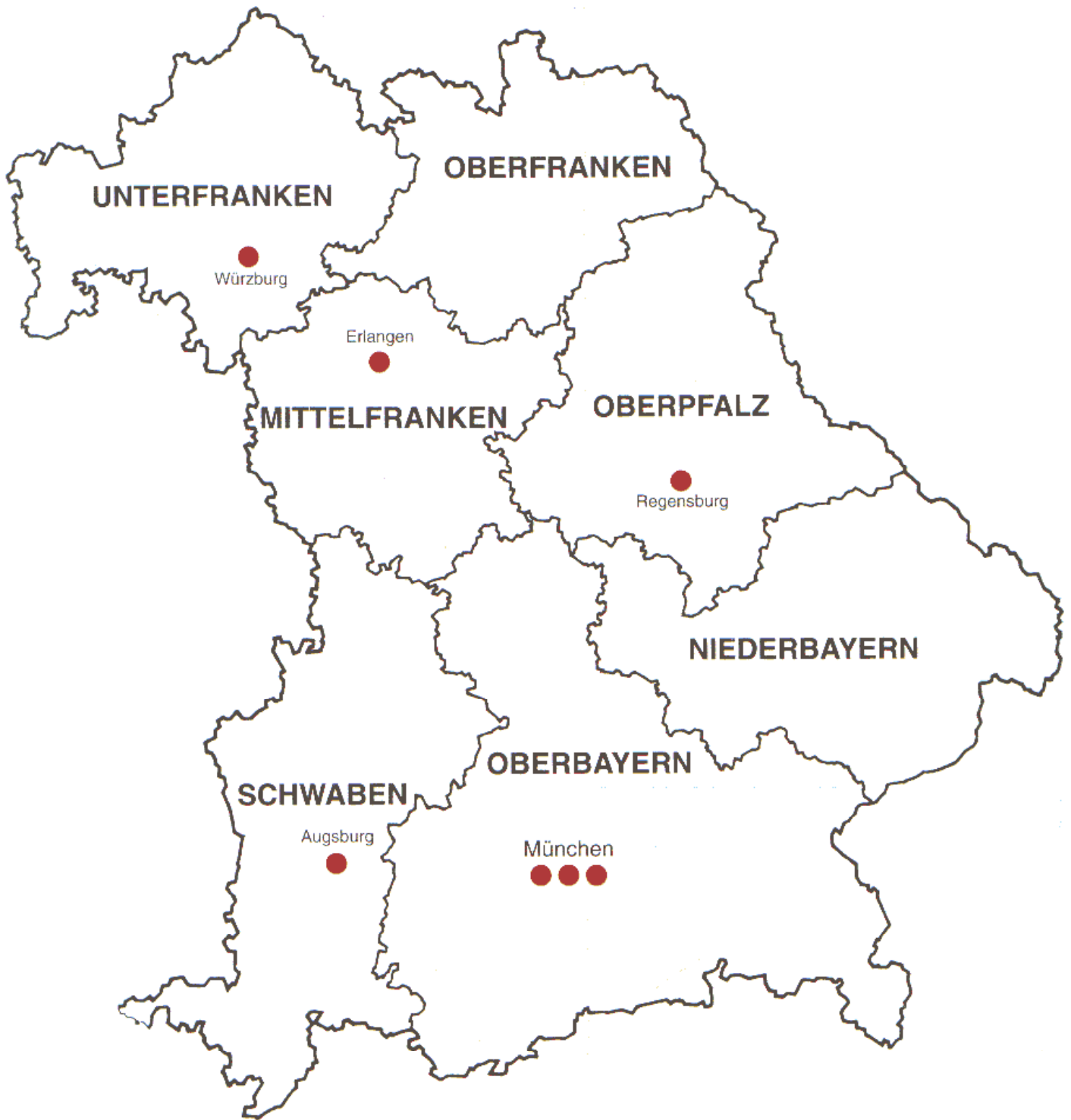
● Transplantationszentren in Bayern